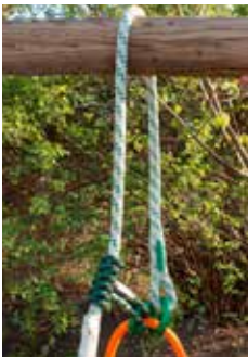
pic. 1) with ringLOOP

This anchor device can be used in two possible configuration: