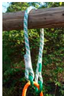
Abb. 2) ohne ringLOOP