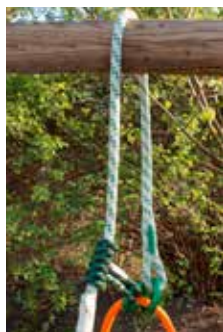
Abb. 1) mit ringLOOP

Diese Anschlagereinrichtung kann auf zwei Arten verwendet werden: