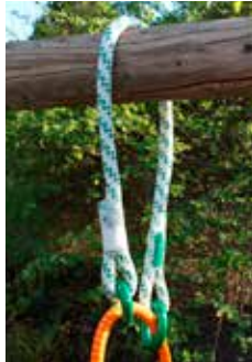
pic. 2) without ringLOOP