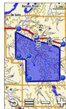
Optional können verschiedene topografische Karten und Straßenkarten angezeigt werden.