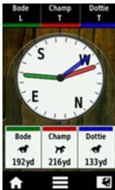
Zeigt Ihren aktuellen Standort und die Positionen ihrer Hunde zuverlässig an.

Das Produkt kann sich von den Abbildungen unterscheiden. © 2013 Garmin Deutschland GmbH. Änderungen vorbehalten. Für Garmin Produkte gelten ausschließlich die Garantiebedingungen, die in den begleitenden Hinweisen zur Garantie für diese Produkte ausdrücklich genannt sind. Keine der Angaben in dieser Dokumentation darf als zusätzlicher Garantiesanspruch gewertet werden. Garmin haftet nicht für technische oder redaktionelle Fehler oder Auslassungen in dieser Dokumentation. www.garmin.de