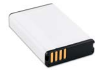
Lithium-Ionen Akku (Alpha 100)

Art.-Nr.: 010-11828-03 EAN: 0753759992507 UVP: €39,99